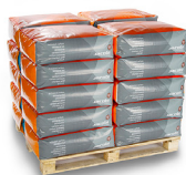
Ventilsäcke aus PE, 20 Säcke pro Palette.